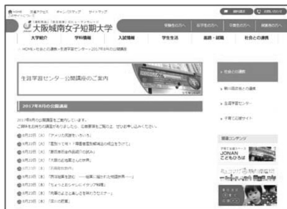
大阪城南女子短期大学 生涯学習センター公開講座のご案内