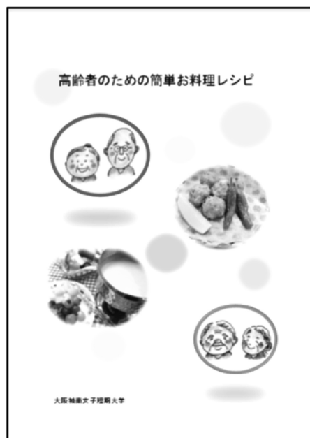
『高齢者のための簡単お料理レシピ』

・「高齢者食事サービス委員会」（和地域・今川地域・田辺地域・南田辺地域・東田辺地域・南百済地域・鷹合地域・矢田北地域・矢田東地域・矢田中地域・矢田西地域・桑津地域・北田辺地域・湯里地域）各委員会の委員