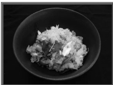
鯛の炊き込み寿司