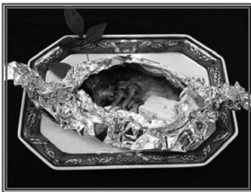
鮭のホイル包み焼き